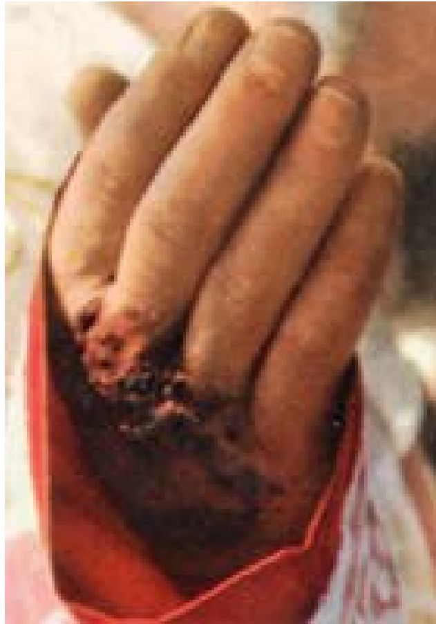
GRUPPO Madonna Addolorata del Perdono