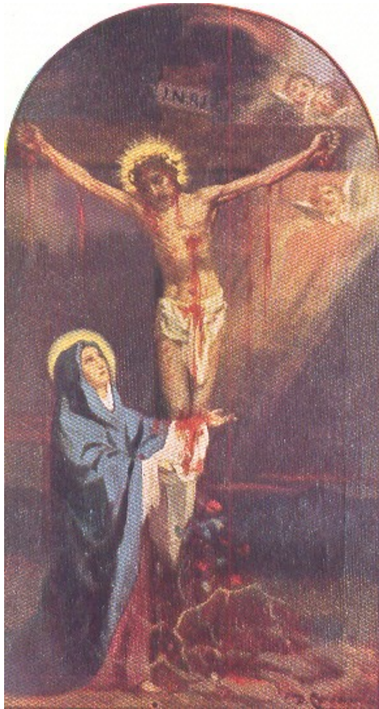
GRUPPO Madonna Addolorata del Perdono