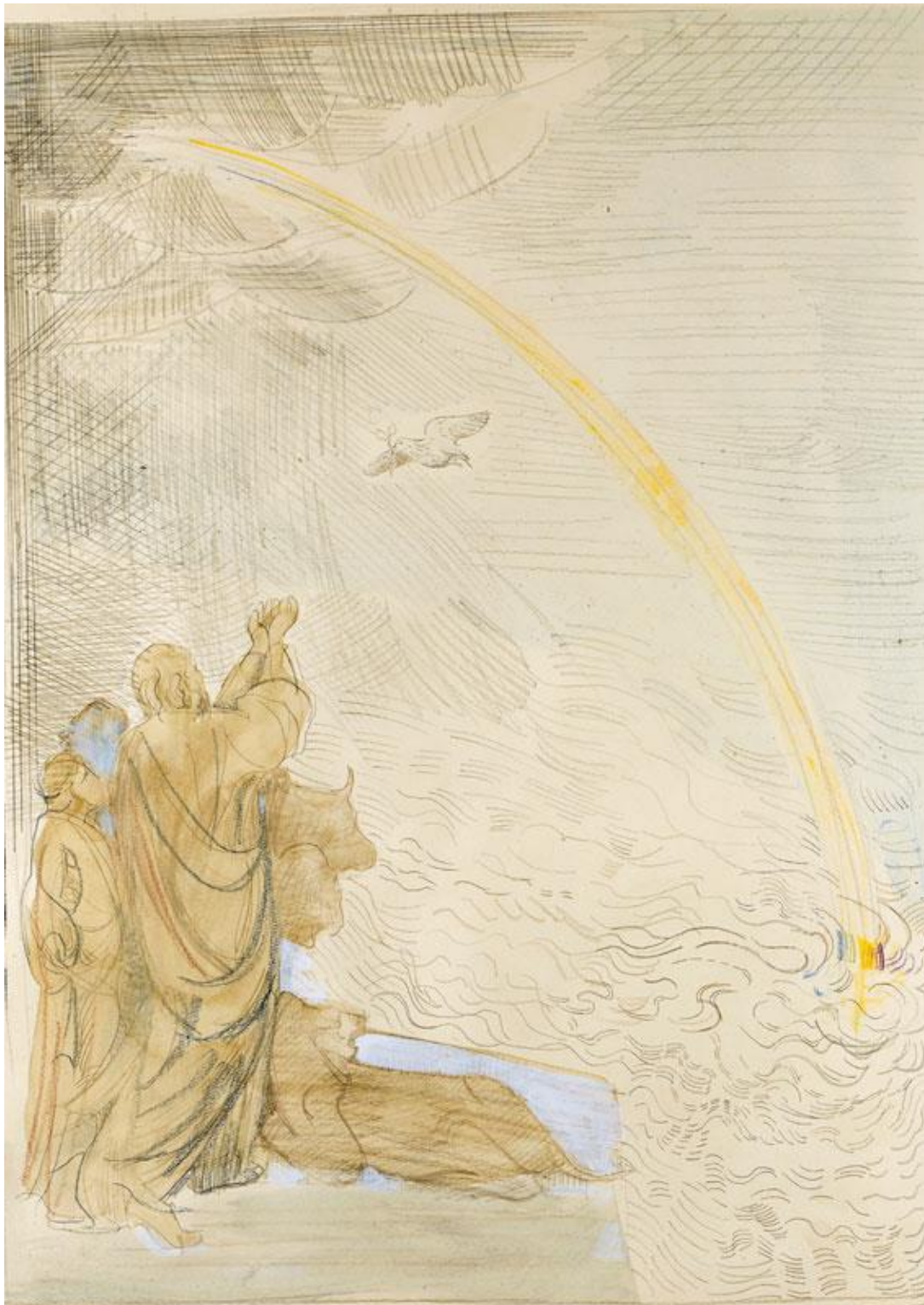
GRUPPO Madonna Addolorata del Perdono