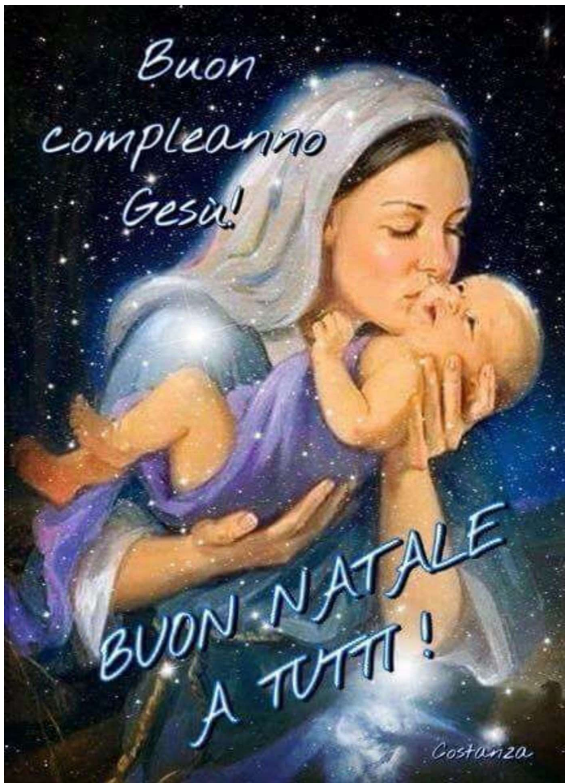
GRUPPO Madonna Addolorata del Perdono